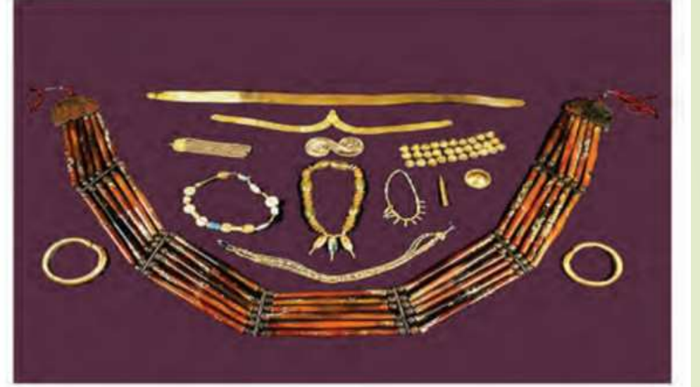
હડપ્પા સંસ્કૃતિના દાગીના