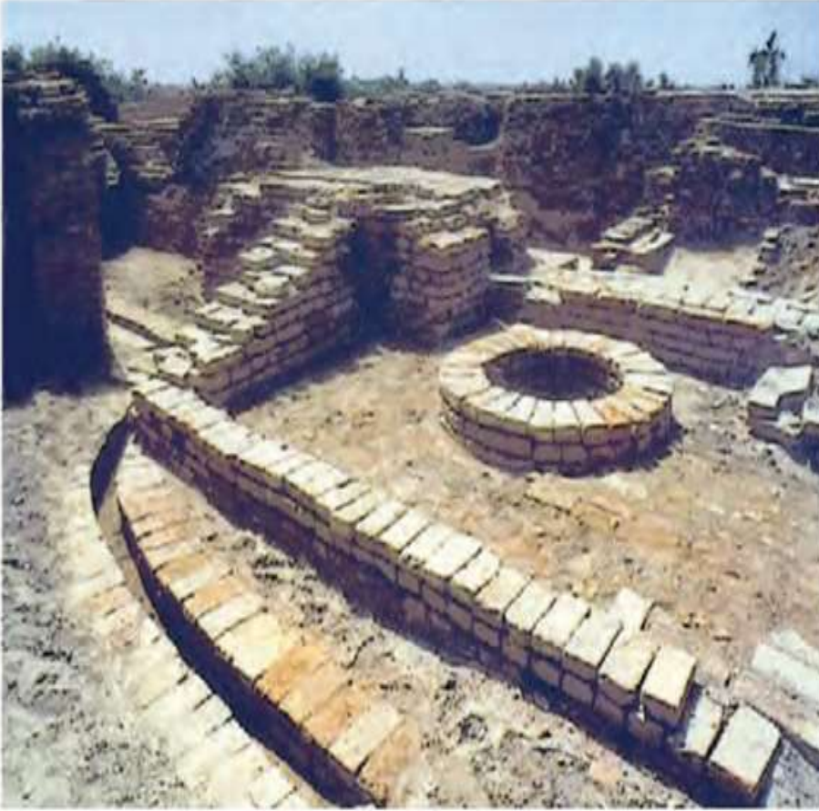
હડપ્પા સંસ્કૃતિના કૂવા