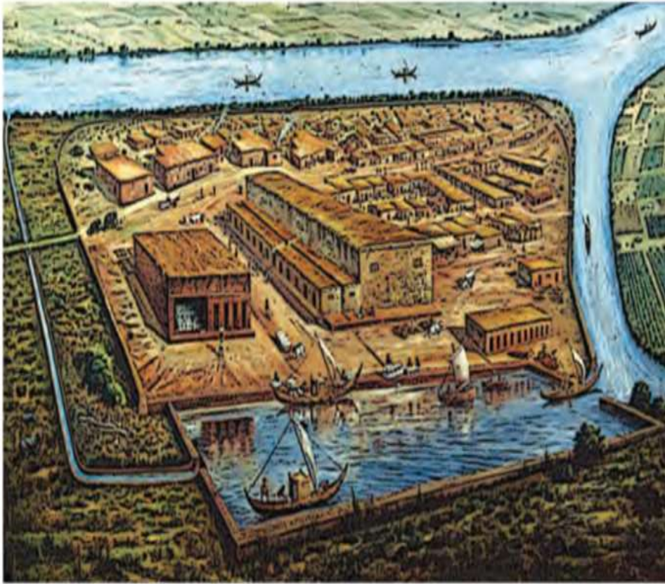
લોથલની ગોદી (અવશેષોના આધારે પુનર્રચના)